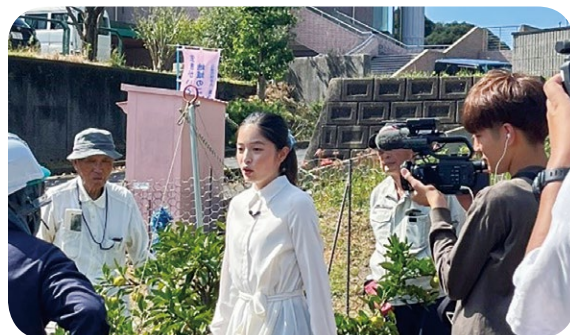
(長崎文化放送「トコサタ」みかん狩り体験取材)