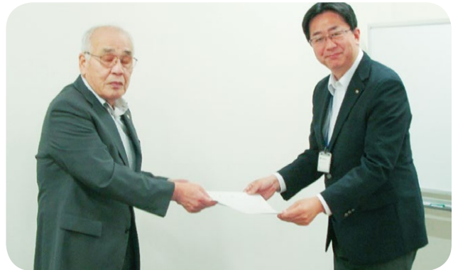
長崎県知事への要望 (井内長崎県産業労働部次長)