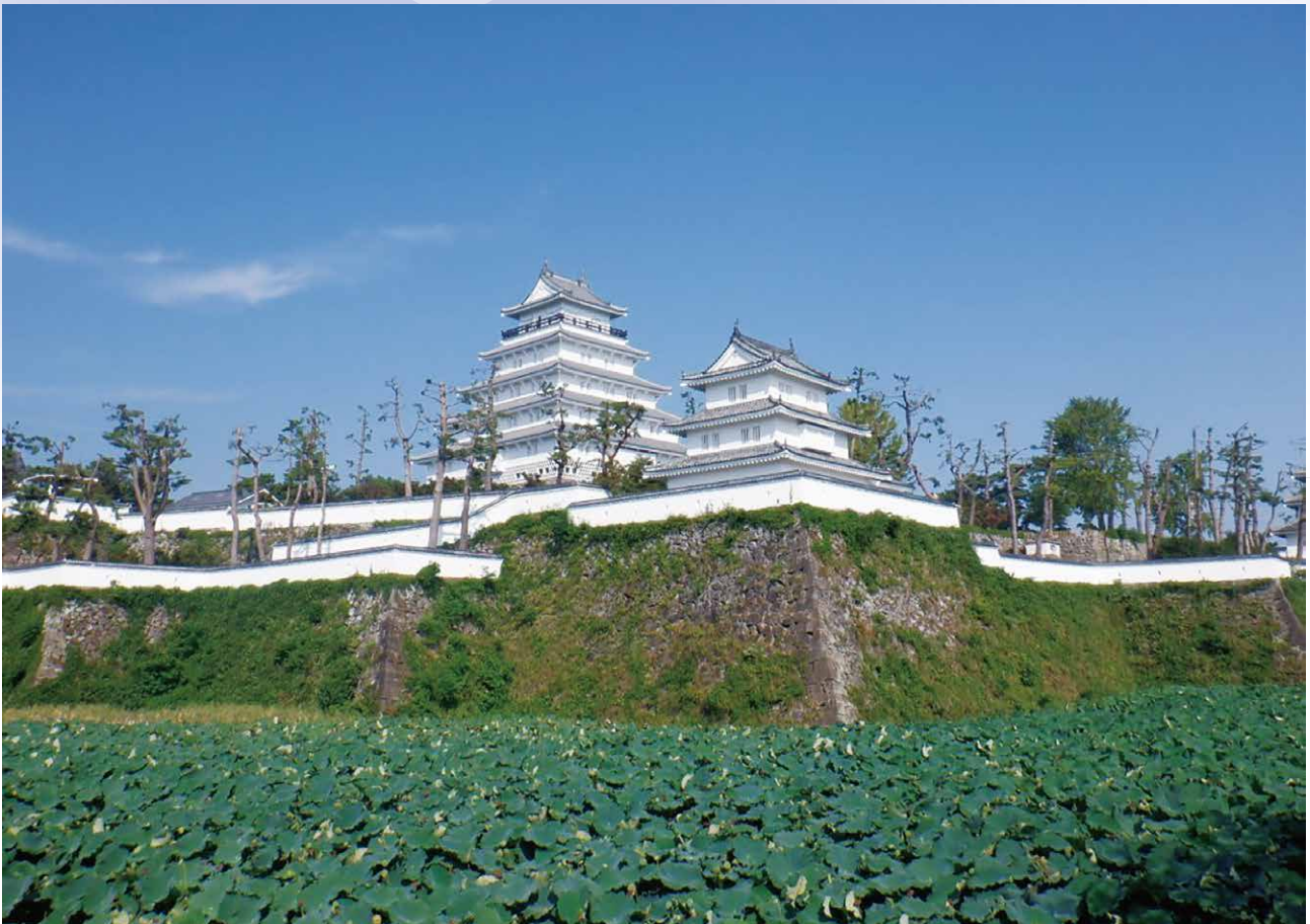
島原城 築城400年（島原市）