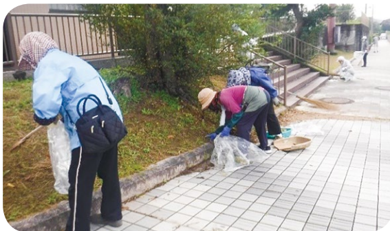
(五島市中央公園周辺部清掃活動)