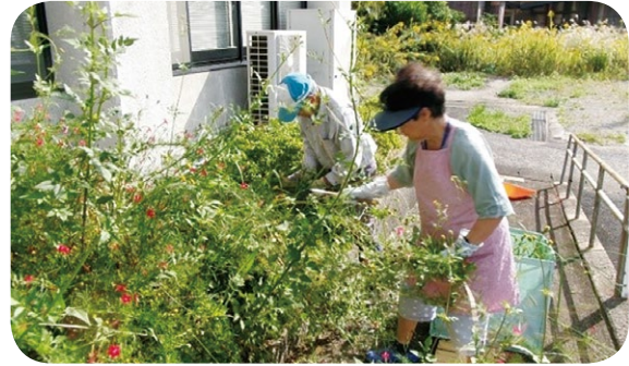
(江迎町猪調住民センター除草、清掃活動)