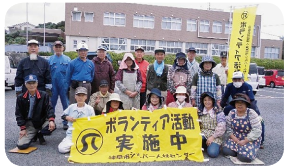
(小長井支所周辺の除草、清掃活動)