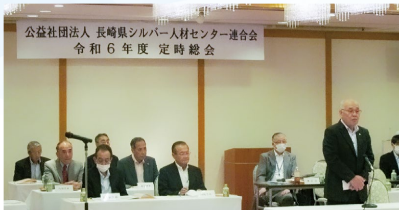
(長崎県シルバー人材センター連合会会長挨拶)