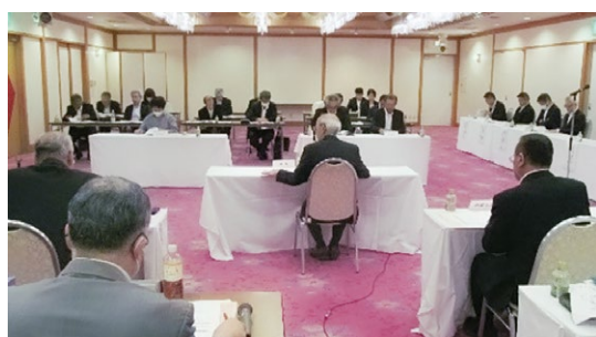
(総会議事進行の様子)