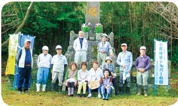
(今福慰霊塔周辺除草、草刈活動)