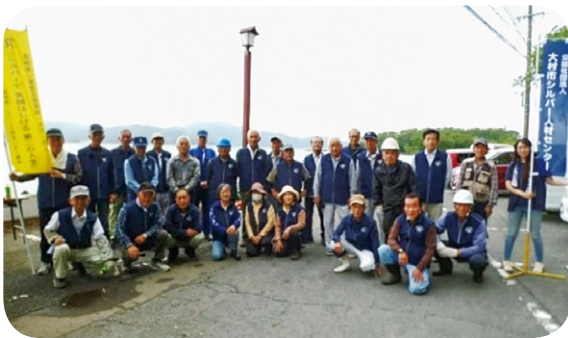
(大村公園清掃活動)