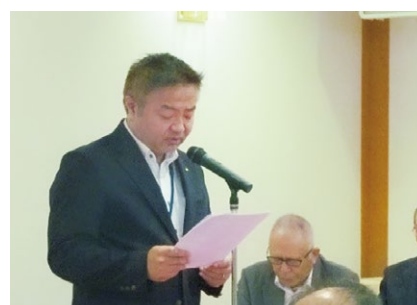
(長崎県産業労働部長のご祝辞) 長崎県雇用労働政策課長代読

(公社) 長崎県シルバー人材センター連合会の令和6年度定時総会を、令和6年6月17日(月) ホテルセントヒル長崎において開催しました。