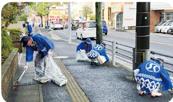
(各町内の歩道等の除草、清掃活動)