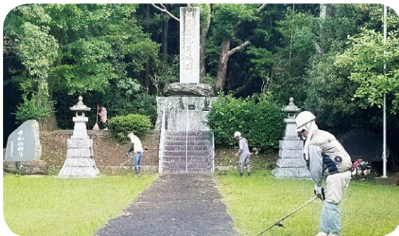
(国分忠魂碑広場の除草・剪定・清掃活動)