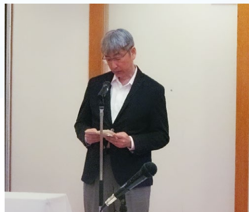
(長崎労働局長のご祝辞)