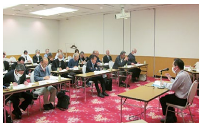
(長崎労働局の説明)