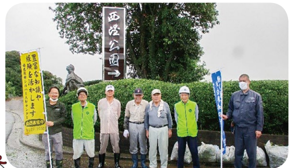
(西望公園清掃活動)