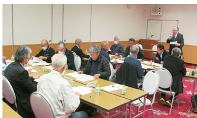
(ヒヤリ・ハット体験事例の概要説明、グループでの意見交換)