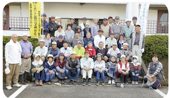
(町体育センター剪定、草刈・清掃活動)