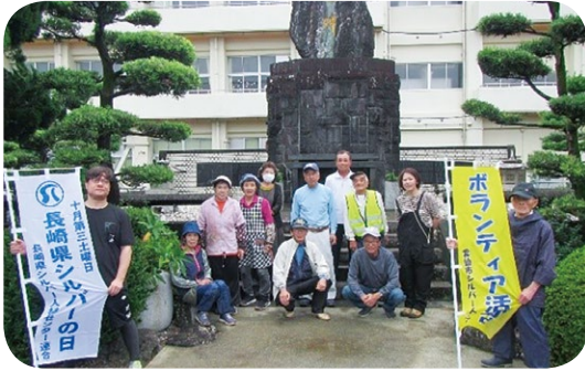
(愛野町忠魂碑周辺除草活動)