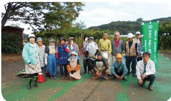
(西彼多目的公園草刈・除草活動)