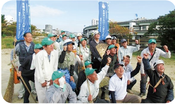
(浦上川河川敷除草・清掃活動)