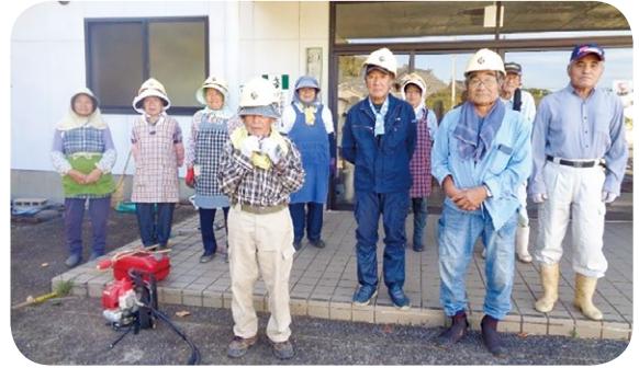
(公民館周囲除草活動)