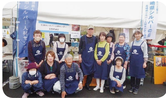
(水軍まつり出店風景：女性委員会)