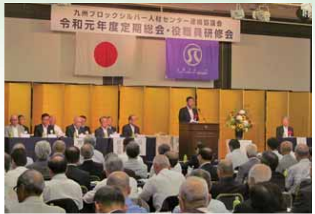
来賓挨拶（長崎県産業労働部長）