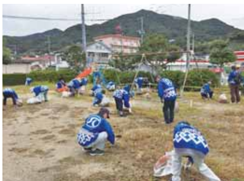
(公園、町道沿線の除草・清掃活動)