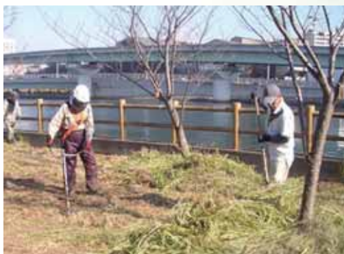
(浦上川河川敷の除草・清掃活動)