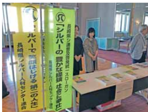
(「九州・山口70歳現役社会推進大会長崎県大会」ブース出展)