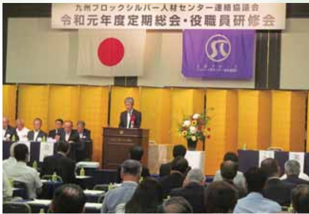
来賓挨拶（長崎労働局長）