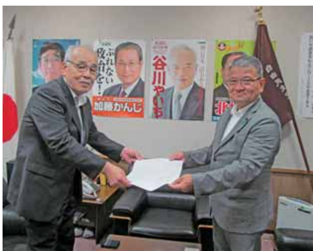
（自由民主党 長崎県支部連合会）