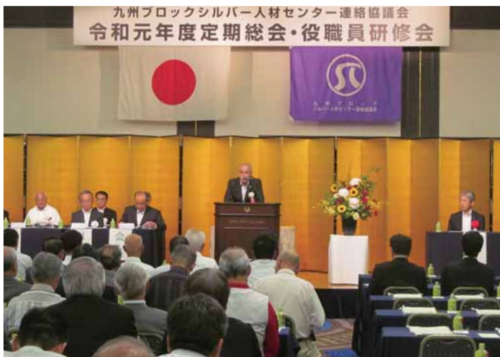
(開催県連合・吉木会長挨拶)