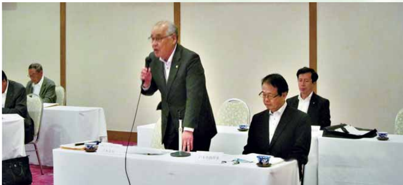
(長崎県シルバー人材センター連合会長挨拶)