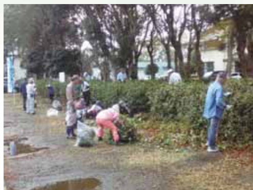
(森園公園内の清掃・草刈活動)