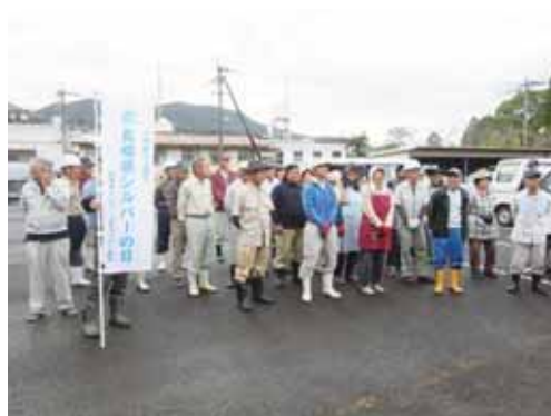
(町民文化会館前の街頭キャンペーン)