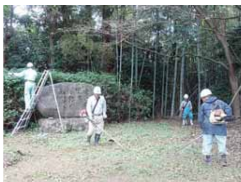
(忠魂碑広場の除草・剪定活動)