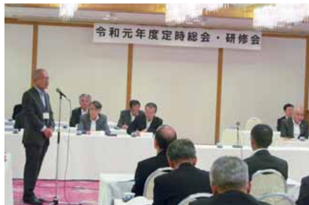
(長崎県産業労働部長挨拶)

(公社)長崎県シルバー人材センター連合会の令和元年度定時総会を、令和元年6月19日(水)セントヒル長崎において開催しました。