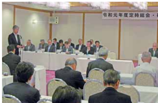
(長崎労働局長挨拶)