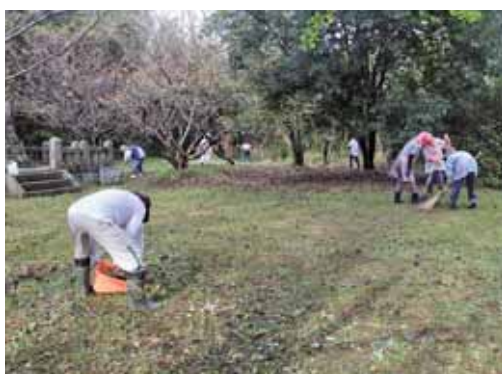
(公共施設の草刈・清掃活動)