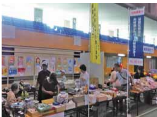
(市福祉健康祭でのチャリティーバザー)