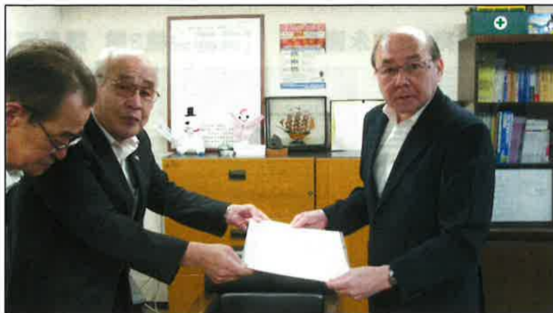
(右側より、小城局長、吉木会長、藤原副会長)