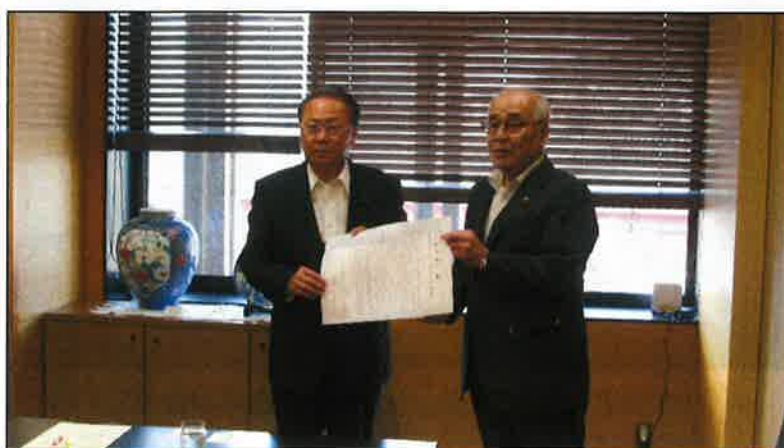
(左側より、徳永議長、吉木会長)